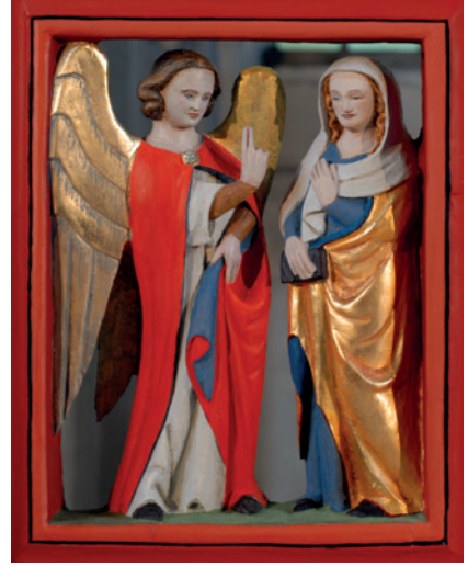
Melek Gabriel Meryem'e Tanrı'nın kudretiyle Oğlu İsa'ya hamile kalacağını müjdeliyor.

Bir çok kilisede meleklerin tasvirleri görülür. Kutsal Kitap'ta melekler Tanrı ile insanlar arasında haberciler olarak görülür. Melekler halkın dindarlığında büyük bir rol oynarlar.