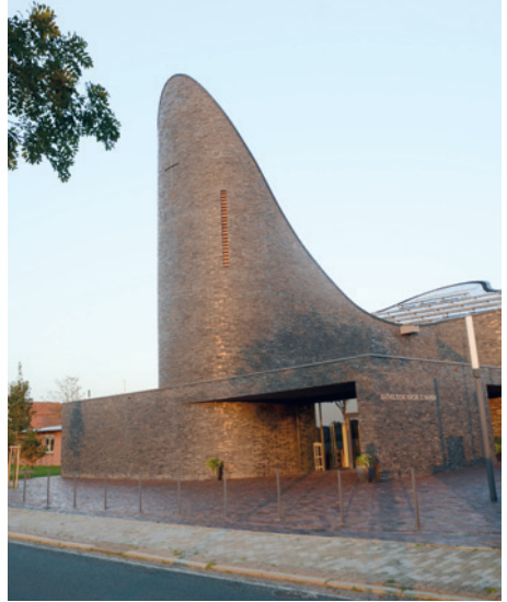
Kilise binaları dışarıdan bu kadar farklı görünebilirler.