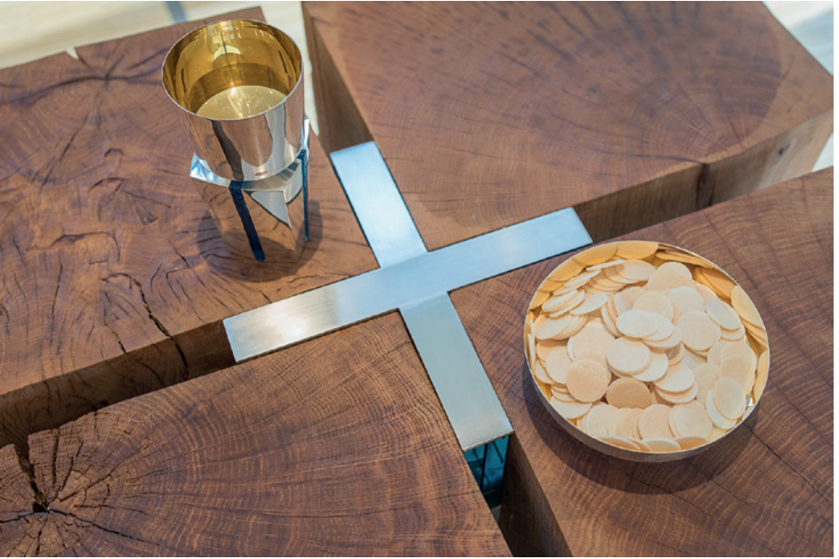
Şarap dolu kadeh ve (yuvarlak "Hostiyeler" şeklinde) ekmek

onlara, bu Son Akşam Yemeği'ni anarak ekmeği ve şarabı aldıklarında kendisinin şahsen bu ekmek ve şarapta mevcut olacağını vadetmiştir.