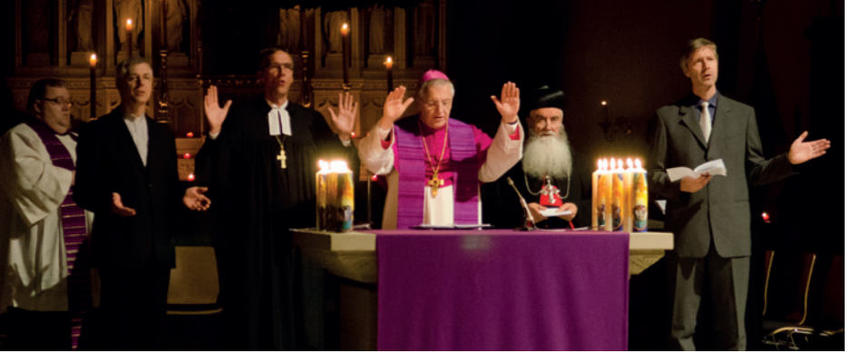
Farklı kiliselerden episkoposlar ve pastörlerle ekümenik bir ayin

Almanya'da bu protestan, katolik ve ortodoks kiliselerin yanında diğer bağımsız kiliseler de vardır. Onlardan bir çoğu bağımsız kilise olarak anılır (bkz. Sayfa 36-37). Ortodoks geleneğindeki hristiyanlık kilise binaları protestan veya katolik kilise binalarından biraz daha farklı görünürler. Farklı bağımsız kiliselerin ibadet mekanları da farklı şekillerde düzenlenmiştir.