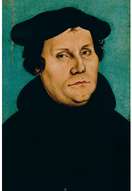
Reformcu Martin Luther

Bir diğer tipik protestan bayramı ise Tövbe ve Dua Günü'dür. Kasım ayının ikinci yarısında, kilise yılının son Pazar gününden önceki Çarşamba günü kutlanır. Tövbe ve Dua Günü imanluları Tanrı'nın önündeki yaşamlarını gözden geçirmeye ve tövbeye çağırır.