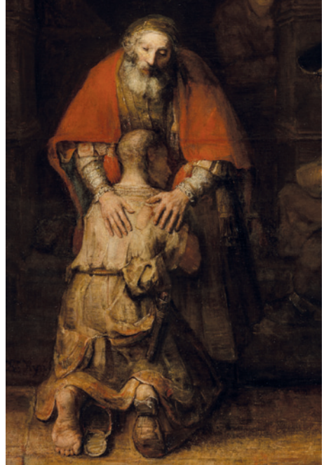
"Merhametli Baba" tablosu Tanrı'nın merhametinden bahsetmektedir.

Kutsal Kitap'taki konular hakkında resimleri özellikle İsa'nın yaşamıyla ilgili olanlar hem protestan hem de katolik kiliselerinde görülebilir. Ancak kiliselerdeki resimler ve sanatsal temsil konusunda farklı düşünce tarzları oluşmuştur.